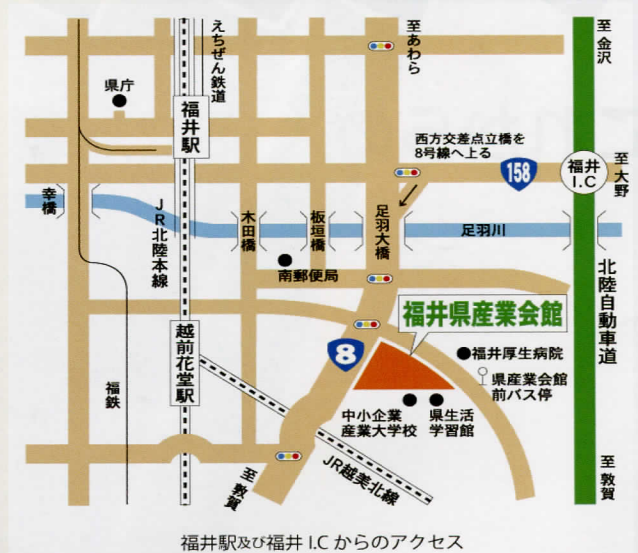
福井駅及び福井 I.C. からのアクセス

フレンドリーバス(公共施設循環バス)にて、 福井駅東側アオッサ前乗り場より乗車し 生活学習館で下車